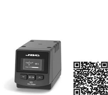
WS 精密高温ワイヤーストリッパー ステーション ..... 1 個 Ref. WS-9UA (100 V)