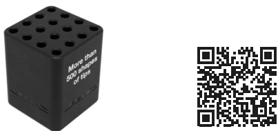
SCH カートリッジホルダー ..... 1 個 Ref. SCH-A