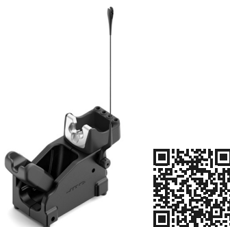
WSBT WS440用スタンド ..... 1 個 Ref. WSBT-B