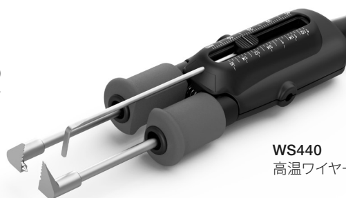
WS440 高温ワイヤーストリッパーピンセット