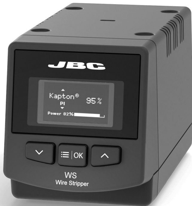
WS 精密高温ワイヤーストリッパー ステーション