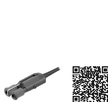
WS440 高温ワイヤーストリッパーピンセ ット ..... 1 個 Ref. WS440-B